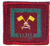
วิชาสัณญาณ