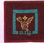
วิชาช่างอากาศ