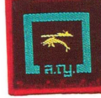
วิชาการดำรงชีพในทะเล