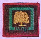
วิชานิเวศน์วิทยา