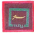
วิชาพายเรือ