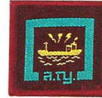
วิชาการควบคุมการจราจรทางน้ำ