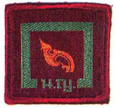
วิชาศิลปวัฒนธรรมไทย