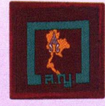
วิชาหน้าที่พลเมือง