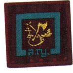
วิชาการป้องกันความเสียหาย และดับเพลิงไหม้บนเรือ