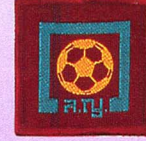
วิชานักกีฬา