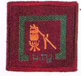
วิชาสุทกรรม