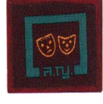
วิชานักแสดงการบันเทิง