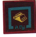
วิชานักพิมพ์ดีด