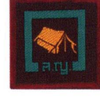
วิชาผู้จัดการค่ายพักแรม