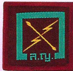
วิชาช่างไฟฟ้า