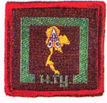
วิชาหน้าที่พลเมือง