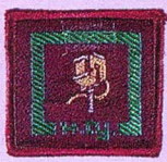
วิชาปาฐกถา