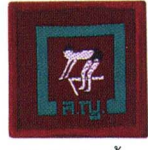
วิชานักว่ายน้ำ