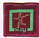
วิชานักกรีฑา