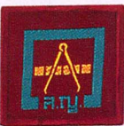
วิชาช่างแผนที่