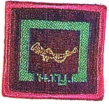
วิชาการศึกษาสังคม