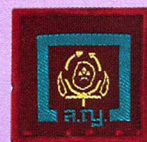
วิชาปฏิบัติทางจิตวิทยา