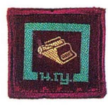
วิชาพิมพ์ดีด