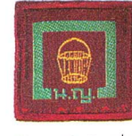
วิชาอาชีพท้องถิ่น