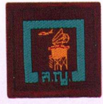
วิชายามอากาศ