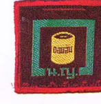
วิชาออมทรัพย์

เครื่องหมายวิชาพิเศษเนตรนารีสามัญรุ่นใหญ่ ถ้าสอบได้ไม่เกิน 9 วิชา ให้ติดที่แขนเสื้อข้างขวา กึ่งกลางระหว่างไหล่กับศอกเรียงกันเป็นแถวตามแนวนอน แถวใดเกิน 3 วิชา ให้ขึ้นแถวใหม่ เว้นระยะระหว่างเครื่องหมายและระหว่างแถว 1 เซนติเมตร ถ้าสอบได้เกิน 9 วิชา ให้มีสายสะพายจากบ่าซ้ายไปประจบกันที่ใต้เอวขวา ทำด้วยตัวนหรือล็กพลาสติกสีเหลืองกว้าง 10 เซนติเมตร ขลิบริมสีขาบข้างละ 1 เซนติเมตร และปักเครื่องหมายวิชาพิเศษ