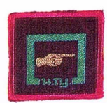
วิชาหมัดकुเทศก์