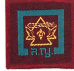
วิชาการดำรงชีพในท้องถิ่นทุรกันดาร