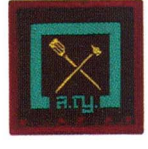
วิชานักสารพัดช่าง