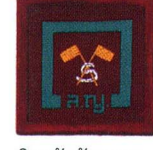
วิชานักสัญญาณ