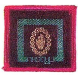
วิชามารยาทในสังคม