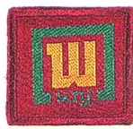
วิชาพลาธิการ