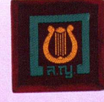
วิชาดนตรี