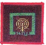
วิชาช่างวิทยุ