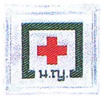
โรงพยาบาล