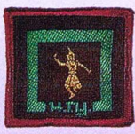
วิชานาฏศิลป์ไทย