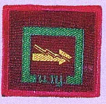
วิชาบรรเทาสาธารณภัย