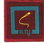
วิชาการพูดในที่สาธารณะ