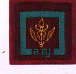
วิชาเสนาธิการ