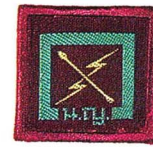
วิชาช่างไฟฟ้า