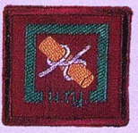
วิชาการบุกเบิก