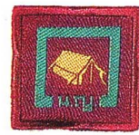
วิชาการศึกษาจัดการค่าย