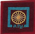
วิชาการสื่อสารด้วยยานพาหนะ