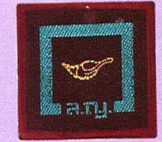
วิชานักประชาสัมพันธ์