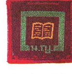
วิชาอ่านหนังสือ