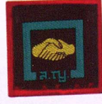
วิชาล่าม