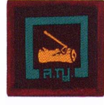
วิชาผู้พิทักษ์ป่า