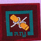
วิชานักบุกเบิก