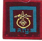
วิชาผู้ช่วยเหลือผู้ประสบภัยและดับเพลิงอากาศยาน