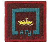
วิชาการเรือ