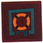
วิชาผู้ช่วยเหลือผู้ประสบภัย