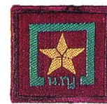
วิชาดาราศาสตร์