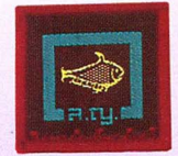
วิชาชาวประมง