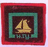
วิชานายท้ายเรือเล็ก