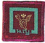
วิชาช่างเครื่องอากาศยาน