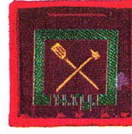
วิชาสารพัดช่าง