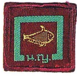
วิชาการศึกษาประวัติศาสตร์