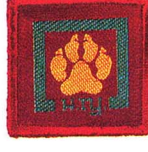
วิชาสะกดรอย