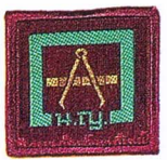
วิชาทำแผนที่