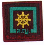
วิชาผู้นำร่อง