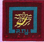
วิชานักกรรเชียงเรือ