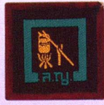
วิชาหัวหน้าคนครัว