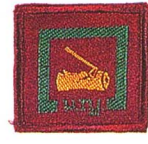
วิชาพิทักษ์ป่า