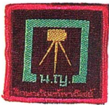
วิชาช่างภาพ