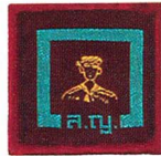
วิชาทะเลสีเรือ