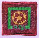
วิชานักกีฬา