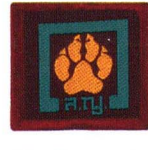
วิชานักสะกดรอย