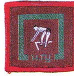
วิชาว่ายน้ำ