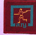
วิชานักกรีฑา