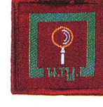
วิชาสะสม