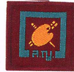
วิชาช่างเขียน