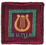
วิชาดนตรี