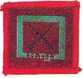
วิชายิงปืน