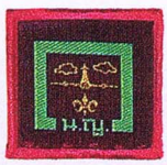
วิชานักเครื่องบินเล็ก