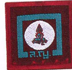
วิชาการสังคมนาฬิกา