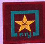
วิชานักดาราศาสตร์