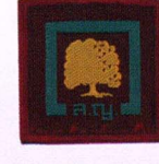
วิชาสงวนทรัพย์การธรรมชาติ