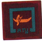
วิชานักพายเรือ