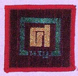
วิชาประกอบพิธีทางศาสนา