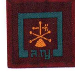
วิชานักอดุนิยมวิทยา