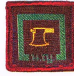
วิชาอนุรักษ์ธรรมชาติ