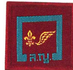
วิชาการพัฒนาชุมชน