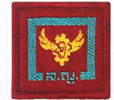
วิชาช่างเครื่องยนต์