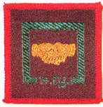
วิชาล่อม