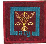
วิชาการขนส่งทางอากาศ