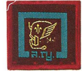
วิชาการควบคุมการจราจรทางอากาศ