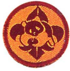
วิชาการอนุรักษ์ธรรมชาติ

ทำด้วยผ้าสีเสือดหมี รูปสี่เหลี่ยมจัตุรัส ยาวด้านละ 4 เซนติเมตร มีกรอบและอักษร “ส.ญ.” สีเขียว ภายในกรอบมีรูปตามกำหนด