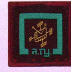
วิชาอิเล็กทรอนิกส์