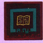
วิชาบรรณารักษ์

เครื่องหมายวิชาพิเศษลูกเสือสามัญรุ่นใหญ่ ถ้าสอบได้ไม่เกิน 9 วิชา ให้ติดที่แขน เสื้อข้างขวา กึ่งกลางระหว่างไหล่กับศอกเรียงกันเป็นแถวตามแนวนอน แถวใดเกิน 3 วิชา ให้ขึ้นแถวใหม่ เว้นระยะระหว่างเครื่องหมายและระหว่างแถว 1 เซนติเมตร ถ้าสอบได้เกิน 9 วิชา ให้มีสายสะพายจากบ่าซ้ายไปประจบกันที่ใต้เอวขวา ทำด้วย ตัวนหรือสักหลาดสีเหลือง กว้าง 10 เซนติเมตร ขลิบริมสีขาบข้างละ 1 เซนติเมตร และปักเครื่องหมายวิชาพิเศษ