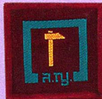
วิชาโบราณคดี