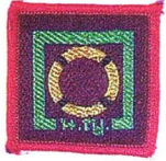
วิชาช่วยผู้ประสบภัยน้ำท่วม