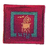
วิชายามอากาศ