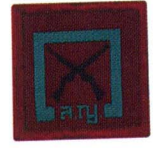
วิชานักยิงปืนเบื้องต้น