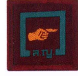
วิชามัคคุเทศก์