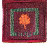
วิชาสงวนทรัพยากร