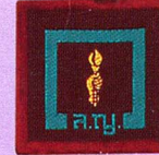
วิชานักผจญภัย