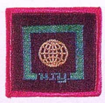
วิชาภูมิตร