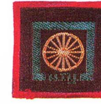
วิชาการสื่อสารด้วยยานพาหนะ