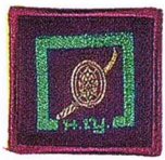
วิชาต่อต้านยาเสพติด