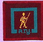
วิชานักเดินทางไกล