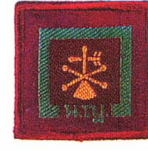
วิชาอุตุนิยมวิทยา