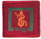
วิชาสาธารณสุข