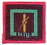
วิชาฟันดาบ