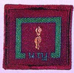
วิชาการผจญภัย