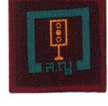
วิชาผู้ช่วยการจราจร