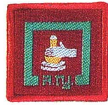
วิชาการศึกษาฝีมือ