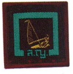
วิชานักเล่นเรือใบ