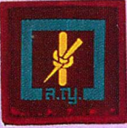
วิชาเต้น