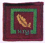
วิชาธรรมชาติวิทยา