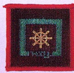
วิชานำร่อง