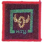
วิชาช่างเครื่องยนต์