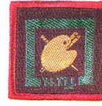
วิชาศิลปะ