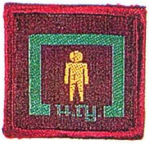
วิชาประชากรศึกษา