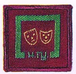
วิชานักแสดงการบันเทิง