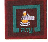
วิชาการฝีมือ