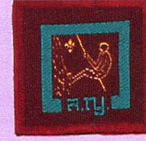
วิชานักโตหน้าผา