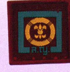
วิชาเครื่องหมายเชิดชูเกียรติ ลูกเสือเหล่าสมุทร