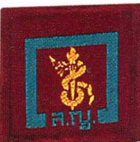
วิชาการสาธารณสุข