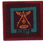
วิชาแผนที่ทหารและเข็มทิศ