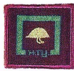
วิชาธรณีวิทยา