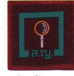
วิชานักสะสม