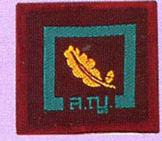
วิชานักธรรมชาติวิทยา