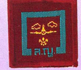
วิชานักเครื่องบินเล็ก