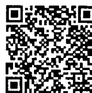
หลักสูตรฝึกอบรมข้าราชการ บรรจุใหม่ (001M)

ท่านสามารถเข้าศึกษา Infographic “การสมัครสมาชิกและการ Log in เข้าสู่ระบบ” โดยสแกน QR Code นี้